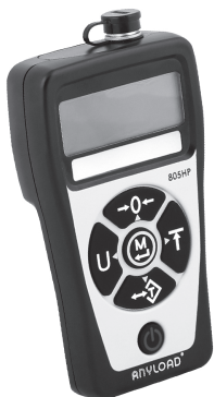
称重显示器键板图